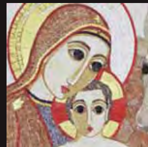
Particolare del mosaico "Natività" - Chiesa inferiore di San Pio da Pietrelcina, San Giovanni Rotondo (FG) Detajli mozaika "Jezusovega rojstva" - Kripla v cerkvi svetega Pija iz Pietrelcine, San Giovanni Rotondo (FG)

Dio nessuno lo ha mai visto; il Figlio unigenito, che è Dio ed è nel seno del Padre, è lui che lo ha rivelato. (Gv 1,18)