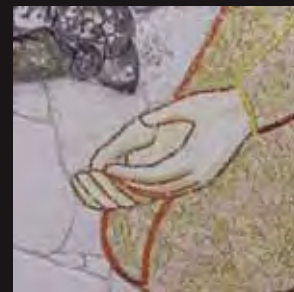
Detajl mozaika "Odpuščanje prešušnici" - Kripta v cerkvi svetega Pija iz Pietrelcine, San Giovanni Rotondo (FG)

"Chi di voi è senza peccato, getti per primo la pietra contro di lei". E, chinatosi di nuovo, scriveva per terra. (Gv 8,7-8)